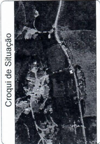
Croqui de Situação