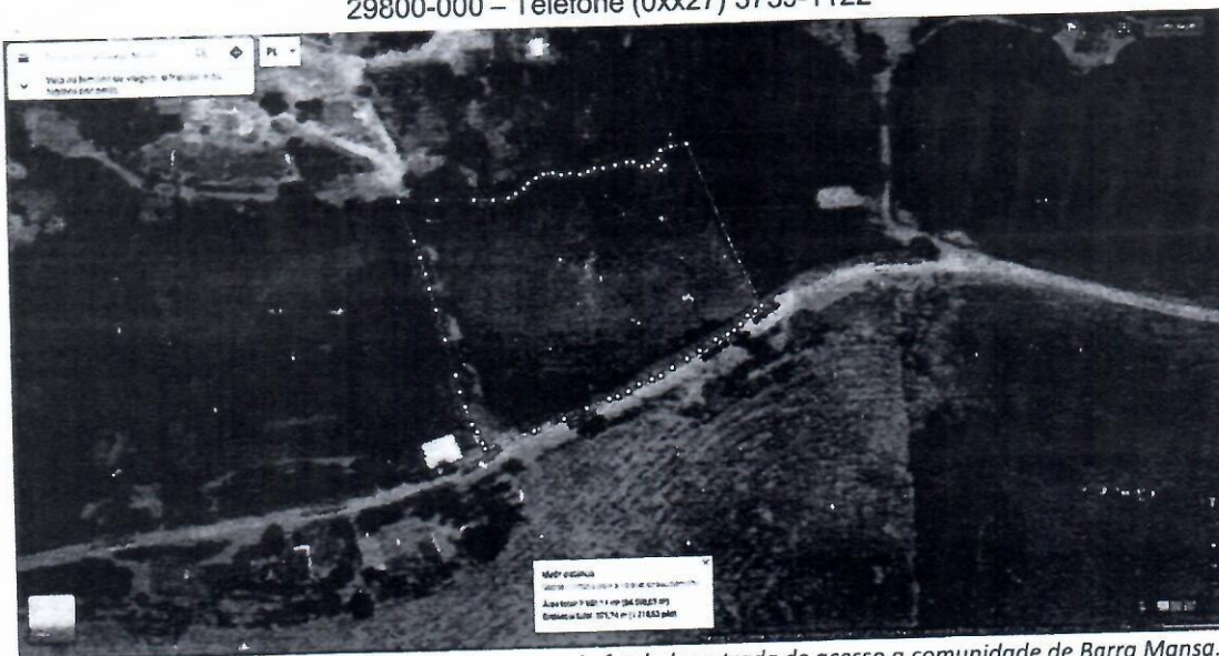
Figura 1: Demonstrativo de área levantada: campo de futebol e estrada de acesso a comunidade de Barra Mansa.