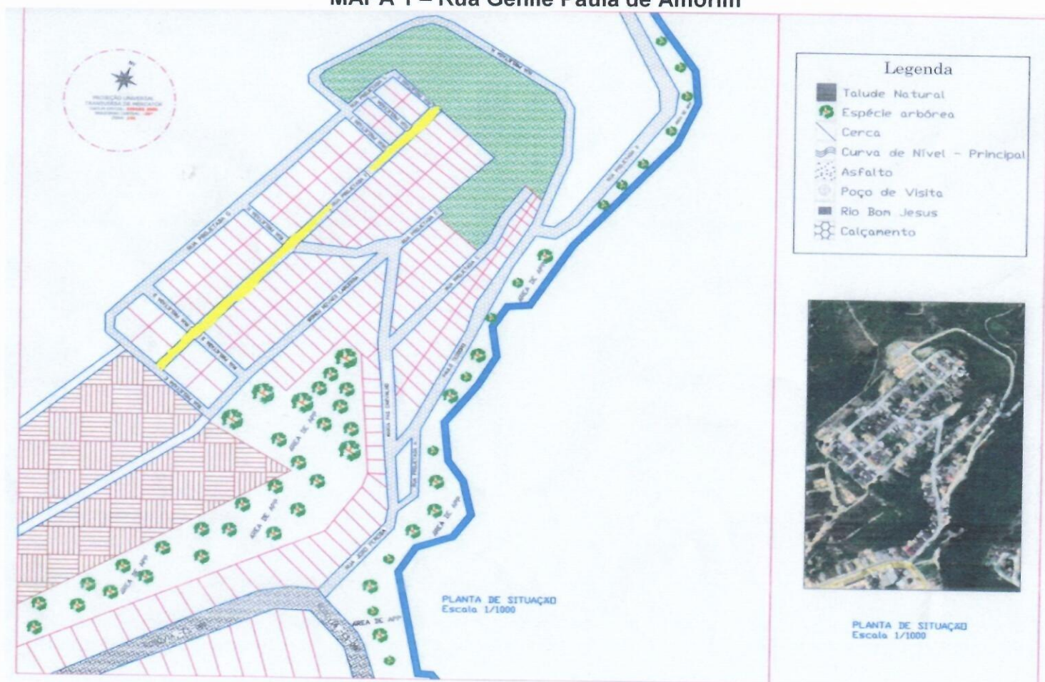
MAPA 1 – Rua Genile Paula de Amorim

Com início na Rua Projetada K, interseção com as Ruas Projetadas J, H, I e D e termina com sua interseção com a Rua Projetada E.