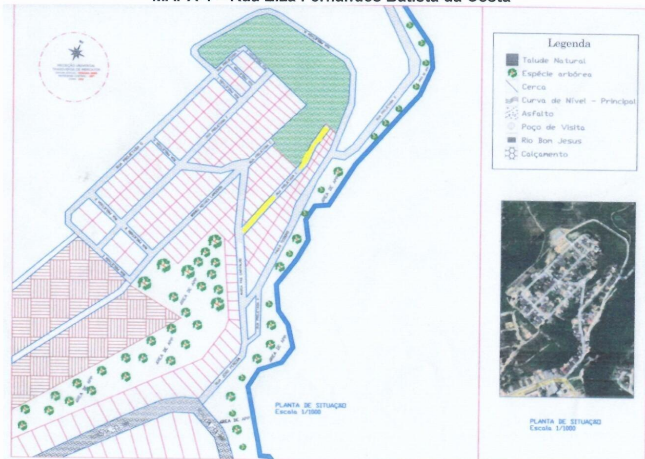
MAPA 4 – Rua Elza Fernandes Batista da Costa

Tem início na Rua Maria da Paz Carvalho e Termina sem haver saída no fim da área urbana.