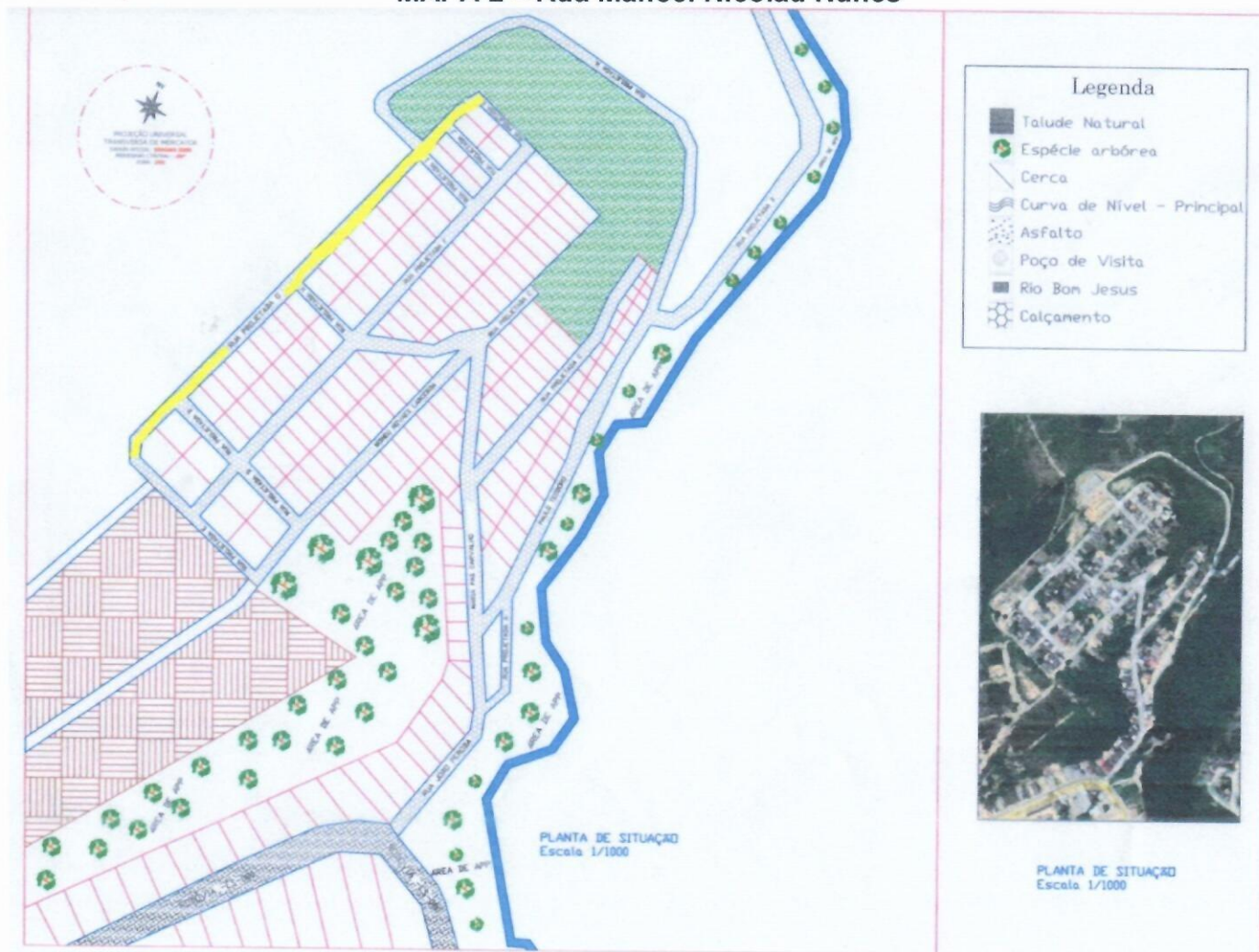
MAPA 2 – Rua Manoel Nicolau Nunes

Com início na Rua Projetada K, interseção com a Rua Projetada J, depois com a Rua Paulo Teodoro de um lado e com a rua projetada I de outro, adiante interseção com a rua projetada H e D e termina com sua interseção com a Rua Projetada E.