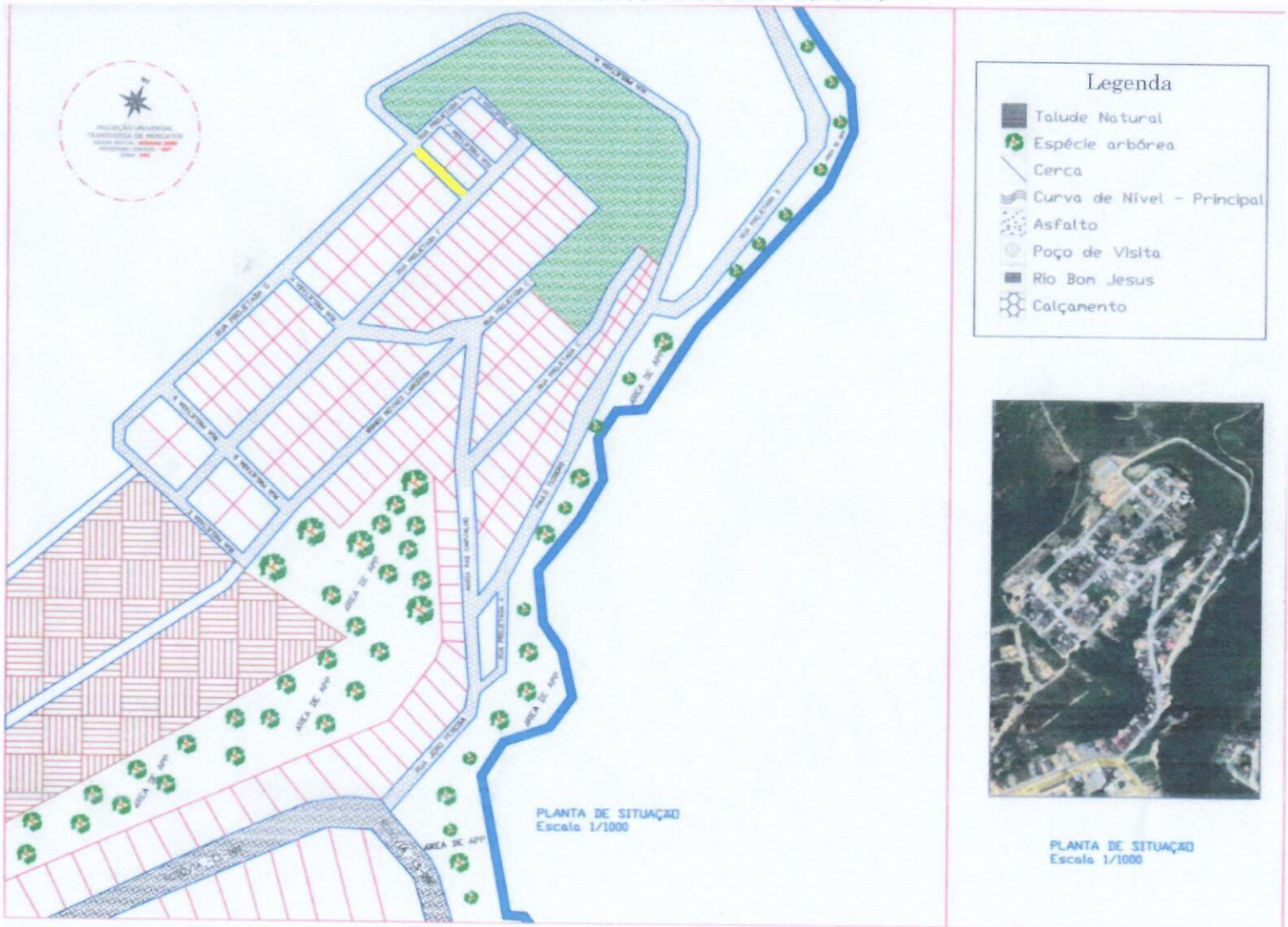
MAPA 7 – Travessa Nilsa Laia da Silva

A travessa Nilsa Laia da Silva Inicia na Rua projetada F e termina na Rua projetada G, no local onde se intersecciona com a Rua Paulo Teodoro.