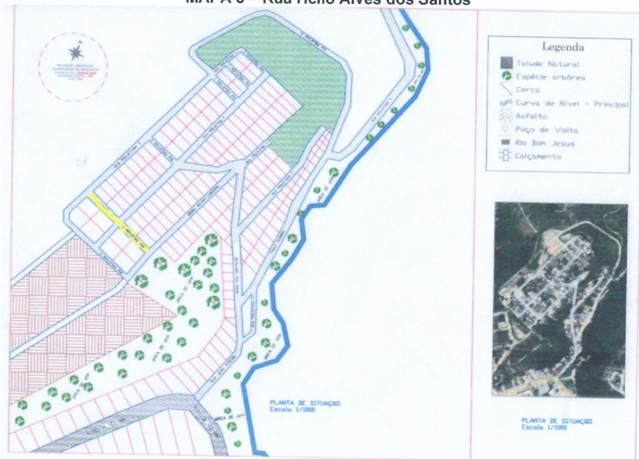
MAPA 3 – Rua Helio Alves dos Santos

Com início na Rua Ireneu Novaes Lacerda, cruza a Rua Projetada F e termina na Rua Projetada D.